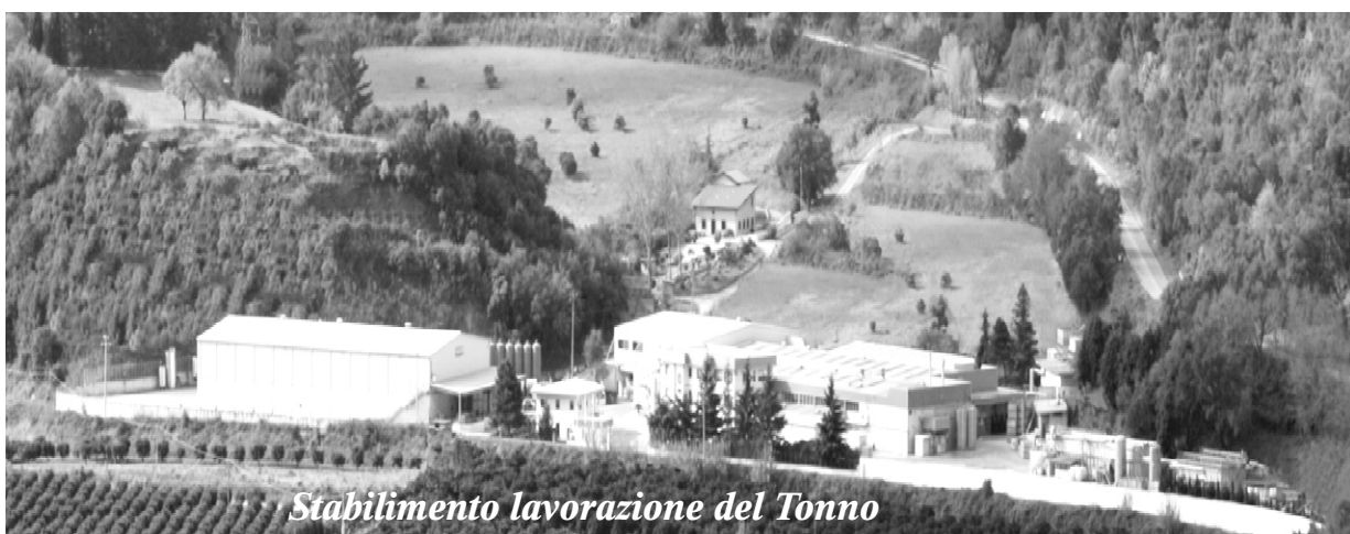
Stabilimento lavorazione del Tonno

Quello di lavorare in un contesto territoriale che sappia apprezzare le ricadute sociali dell’azienda stessa e